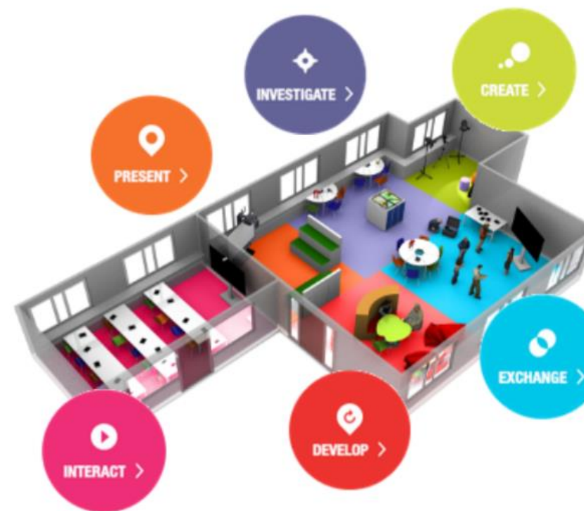
Future Classroom Lab – European Schoolnet